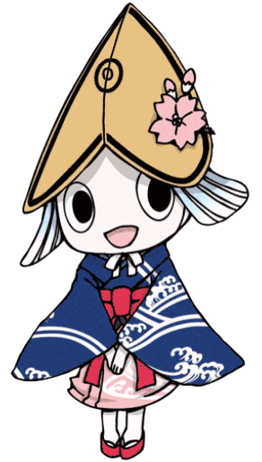
徳島市イメージアップキャラクター「トクシイ」