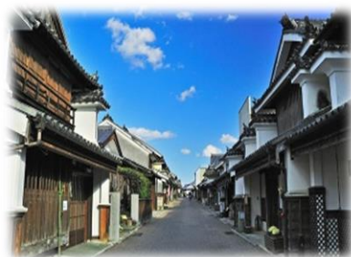
脇町うだつの町並み