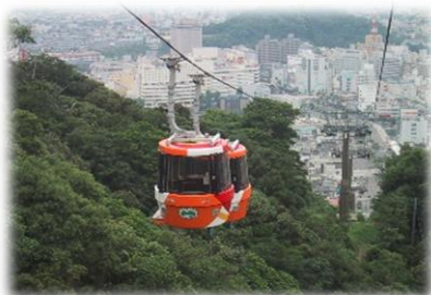
眉山ロープウェイ