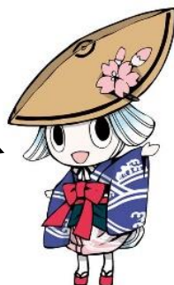
徳島市イメージアップキャラクター「トクシイ」